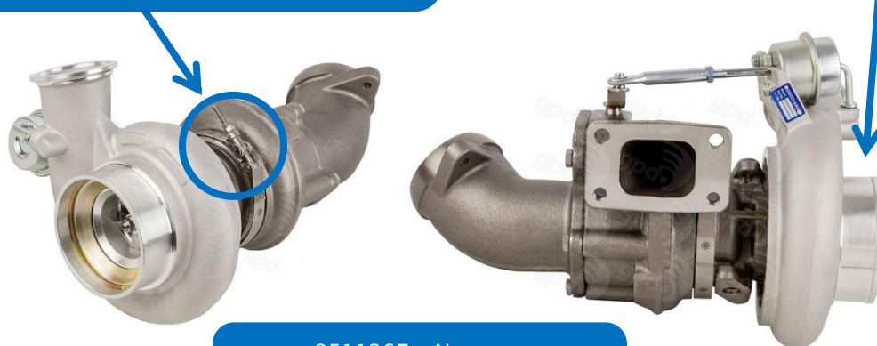
2511267 – Nouveau turbocompresseur Transmission automatique

Le modèle 2511267 comporte un collier de type banjo sur le carter de turbine côté échappement.