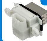
1712678 ; Front ; Climatisation automatique; Blanc

Applications Ford Expedition : – 2007–2010 5.4 V8