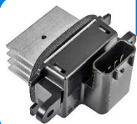
1712398 ; Front ; Climatisation automatique; Noir

Applications Ford Expedition : – 2007–2010 5.4 V8