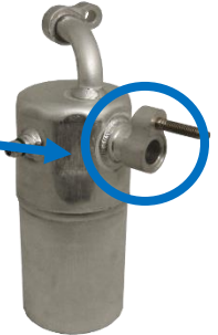
1411647 – 1er modèle Sans climatisation arrière

N'oubliez pas de refaire l'isolation de l'accumulateur après son remplacement pour éviter la "transpiration", qui réduit l'efficacité du refroidissement.