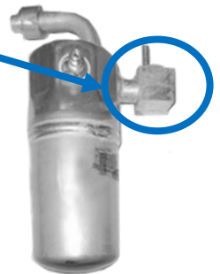
1411734 – 1er modèle Avec climatisation arrière