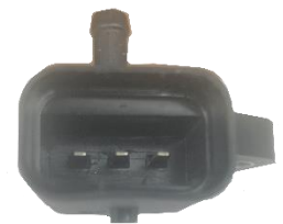
Conector en el modelo más nuevo