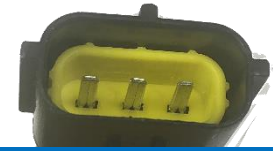
Conector en el modelo antiguo

– Retire el adaptador si reemplaza un modelo más nuevo. Por lo general, el nuevo modelo tendrá un estilo de espalda cuadrada.