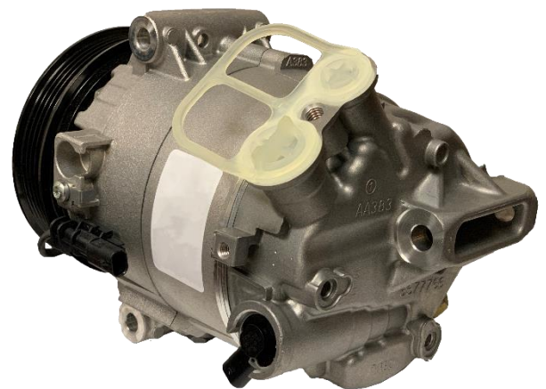
Diseño de la competencia sin Orificios de los pernos de montaje